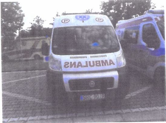
FIAT AMZ KUTNO DUCATO 180 MULTIJET – Ambulans sanitarny