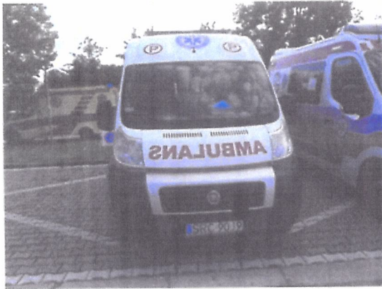
FIAT AMZ KUTNO DUCATO 180 MULTIJET – Ambulans sanitarny